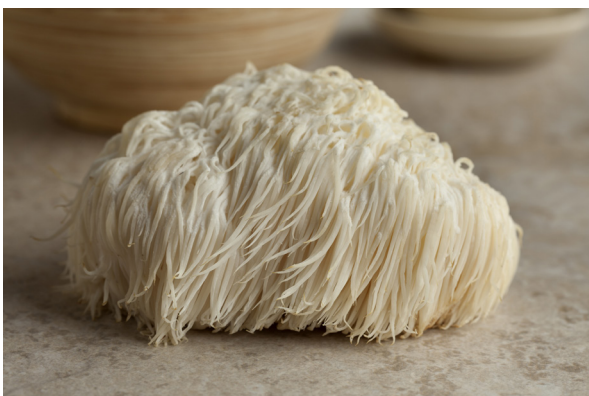
FIGURA 1 - Corpos de frutificação (cogumelos) do fungo Herichium erinaceus .

Hericium erinaceus , que devido ao seu aspecto bastante característico também é conhecido como Lion's Mane (do inglês, juba de leão), é um cogumelo comestível amplamente utilizado na Medicina Tradicional Chinesa devido ao efeito nootrópico e neuroprotetor de alguns de seus metabólitos que atuam como compostos bioativos no organismo, incluindo erinacinas, hericenonas, esteroides, alcaloides e lactonas. O consumo de Lion's Mane está associado ao aumento da plasticidade sináptica e formação de novos neurônios e conexões sinápticas no sistema nervoso central, resultantes do aumento dos níveis de expressão do fator neurotrófico de crescimento neuronal (NGF). Além disso, Lion's Mane também possui efeito gastroprotetor, que pode ser explorado para o tratamento de lesões decorrentes da infecção por Helicobacter pylori ou do uso crônico de anti-inflamatórios não esteroidais. 1-5